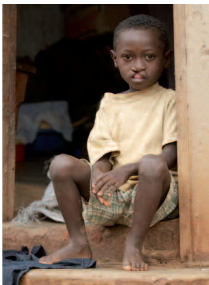
Den Film zu Fred sehen Sie auf www.youtube.com , unter «Fred CBM»!

verwenden können. CoRSU ist eben kein gewöhnliches Spital, sondern eine Oase, in der behinderte Kinder