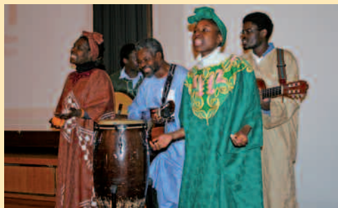
The Kuziems werden uns auch diesmal mit zauberhaften afrikanischen Melodien verwöhnen.

Reservieren Sie sich den Termin und melden Sie sich an – wir freuen uns auf Sie!