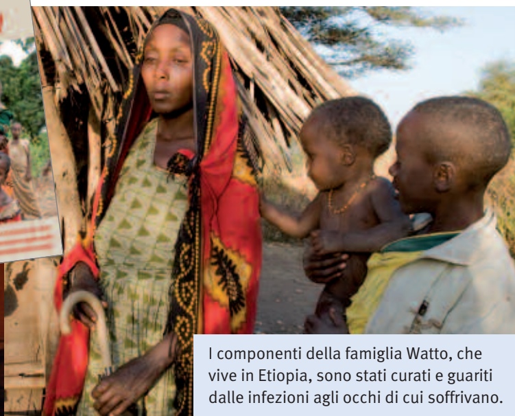
I componenti della famiglia Watto, che vive in Etiopia, sono stati curati e guariti dalle infezioni agli occhi di cui soffrivano.