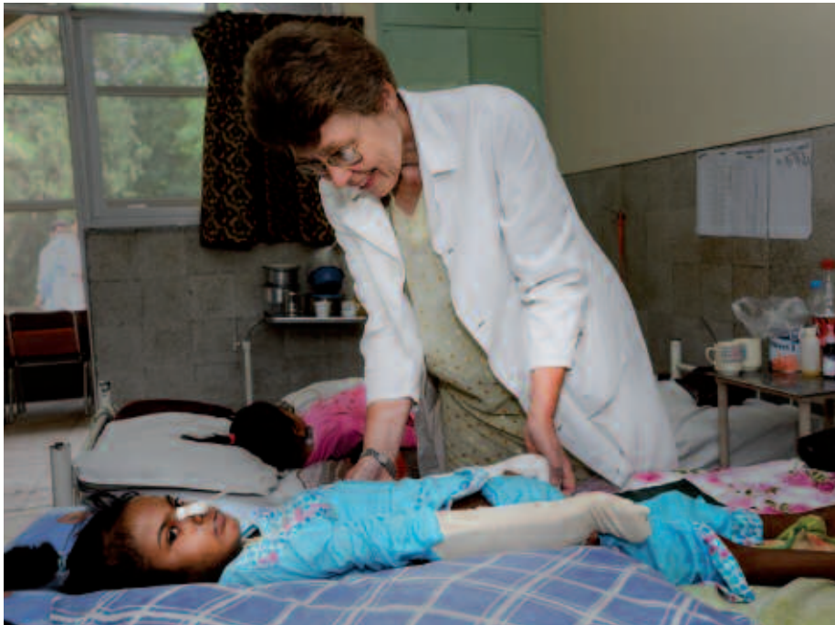
La CBM si batte affinché le persone disabili siano considerate da tutte le organizzazioni e le agenzie statali.

Il 15 per cento delle persone (con)vivono con un'infermità. I progetti di valenza generale devono considerare anche la loro particolare condizione, e la CBM intende far presente a tutti