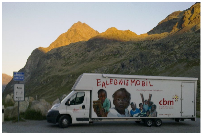
Abbildung 2 EMO Auf dem Weg ins Engadin.

In der Schweiz und in Liechtenstein ist die CBM (Schweiz) mit dem Erlebnismobil unterwegs. Damit sensibilisiert sie für die Lage blinder Menschen bei uns und in Armutsgeländen sowie für das Thema Behinderung. Das Erlebnismobil ist ein Lieferwagen, worin sich ein Gang mit Gegenständen und alltäglichen Hindernissen befindet. Die Besucherinnen und Besucher tasten sich durch diesen Erlebnisgang, ausgerüstet mit einem Langstock und einer die Graustarblindheit simulierenden Brille. Im Jahr 2019 besuchten wir mit dem Erlebnismobil 44 Schulklassen mit 878 Kindern und 73 Lehrpersonen. An sieben kirchlichen Anlässen erhielten weitere 284 Personen die Möglichkeit, sich für einige Minuten ohne Augenlicht zu orientieren.